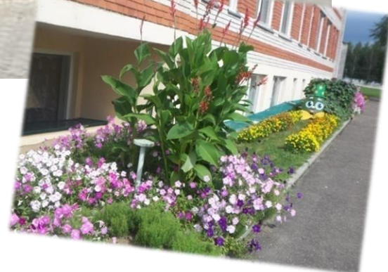
Красненскі Дом культуры, адміністрацыйны будынак Красненскага сельскага Савета і сельскагаспадарчага вытворчага кааператыва "Маяк-Заполле"