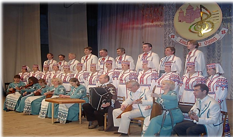
Народны хор Красненскага сельскага Дома культуры

"Маяк", атрымаўшы гэта званне ў 1976 годзе. На сённяшні дзень гэта народны хор народнай песні Аддзела культуры і вольнага часу "Красненскі Дом культуры". У складзе калектыву хору выступаў знакаміты за межамі нашай Радзімы вакальны ансамбль "Монічы", а ў 1989 годзе з саставу Запольскага хору выдзеліўся гурт народнай музыкі і песні "Забава", атрымаўшы ў 1996 годзе званне народнага.