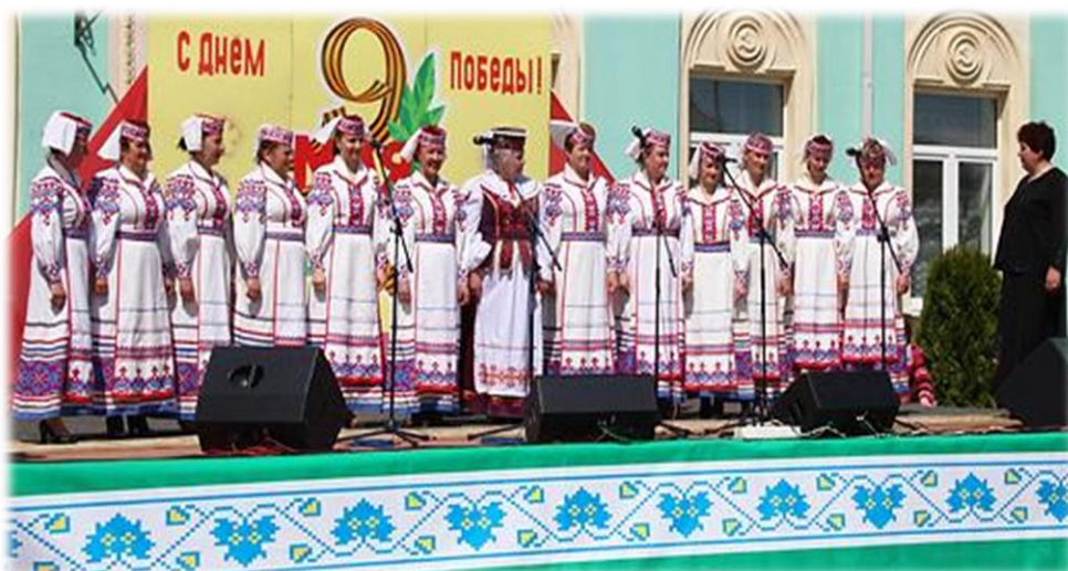
Жаночая вакальная група народнага хора Красненскага СДК