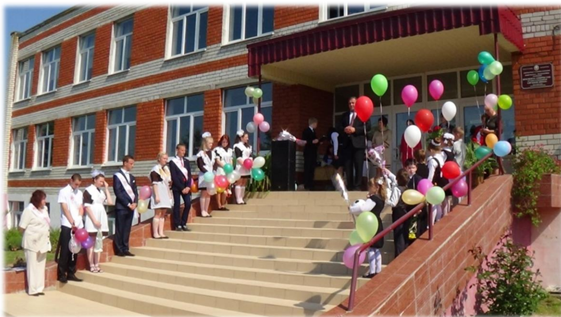
Педагагічны комплекс “Дзіцячы сад-школа” у аграгарадку Краснае

На сённяшні дзень у рэгіёне паспяхова развіваецца інфраструктура і падтрымліваюцца сацыяльныя стандарты, што забяспечвае надзейнасць у жыццядзейнасці мясцовага насельніцтва.